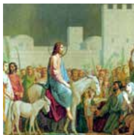
"Benedetto colui che viene, il re, nel nome del Signore".